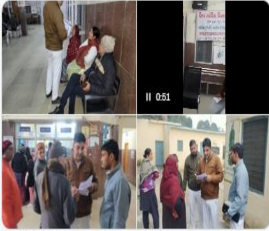
DRM Moradabad NR

#100DaysOfTBElimination @MoHFW_INDIA @RailMinIndia