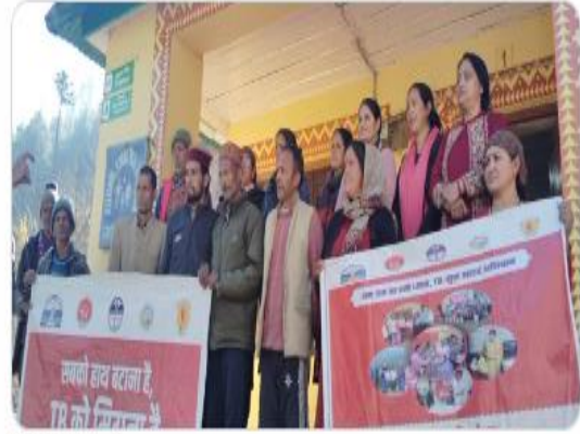
You and 2 others

#TBMuktKullu #TBMuktHimachal #TBMuktBharat #TBHaregaDeshJeetega