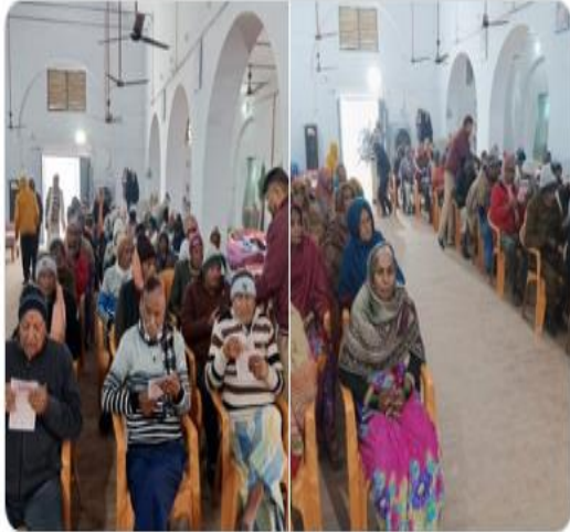
PMO India and 9 others