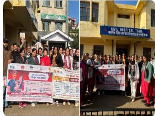
0 1 18