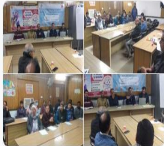
You and 4 others

मुख्यचिकित्साधिकारी महोदय की अध्यक्षता में टी बी मुक्त भारत अभियान के तहत जनपद के प्राइवेट डॉक्टरों की मीटिंग की गई!