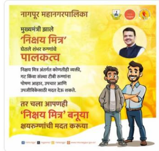
CMD Maharashtra and 5 others

#Tuberculosis #TBMuktBharat #TBHaregaDeshJeetega #TBElimination #HealthDepartment #TB #TBTreatment #TBPrevention #GlobalHealth #HealthForAll #nikshay #nikshaymitra #nmc #nagpur