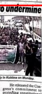
NH members holding rally in Kohima on Monday.