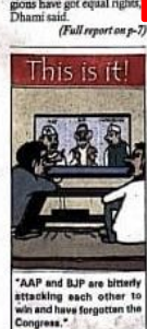
'AAP and BJP are bitterly attacking each other to win and have forgotten the Congress.'