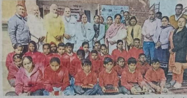
नौरंगाबाद के राजकीय स्कूल में जागरूकता चित्रकला प्रतियोगिता में भाग लेने वाले बच्चे स्टाफ के साथ विज्ञप्ति।