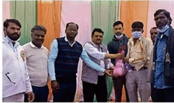
मरीजों को सामग्री वितरित करते हुए जनप्रतिनिधि।