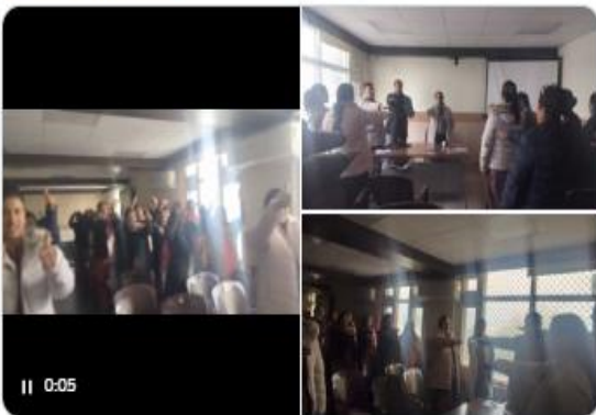
You and 2 others

#TBMuktKullu #TBMuktHimachal #TBMuktBharat #TBHaregaDeshJeetega