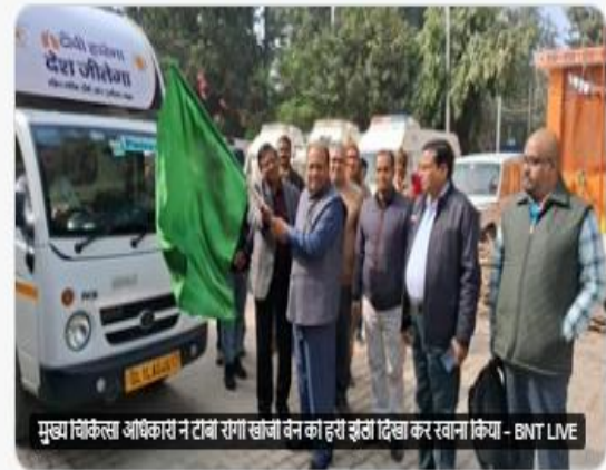
मुख्य चिकित्सा अधिकारी ने टीबी रोगी खोजी वेन को हरी झंडी दिखा कर रवाना किया - BNT LIVE

मुख्य चिकित्सा अधिकारी ने टीबी रोगी खोजी वेन को हरी झंडी दिखा कर रवाना किया bntive.com/72438 #TBMuktBharat #TBHaregaDeshJeetega #centralTBdivision