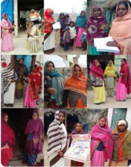
Ministry of Health and 3 others

#TBMuktBharat #100DaysofTBElimination #iodstiloi