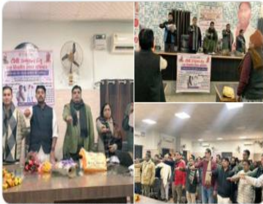
DDG - TB | #TBMuktBharat and 2 others