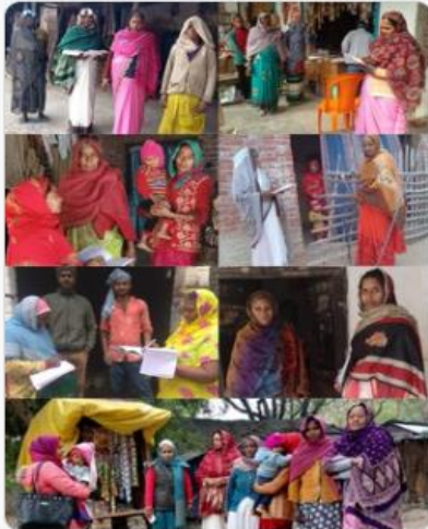
You and 4 others

दिनांक-04.01.25 को विकास खंड में 'टीबी मुक्त अभियान' के तहत आंगनवाड़ी कार्यकर्त्रियों द्वारा घर घर सर्वे करते हुए स्वास्थ्य सेवाओं को लोगों तक पहुंचाने की दिशा में महत्वपूर्ण प्रयास करते हुए जनजागरुकता अभियान चलाया गया। #TBMuktBharat #100DaysofTBElimination #icdstiloi