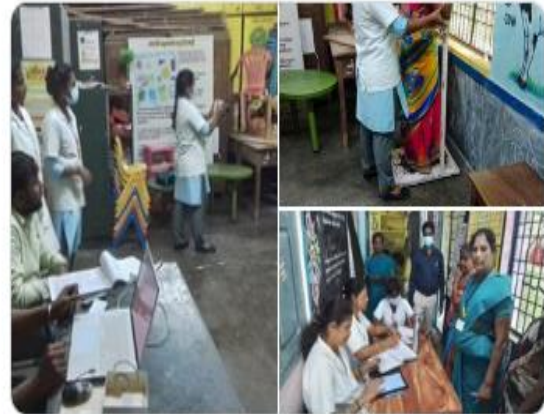
You and 8 others

NTEP Puducherry @NtepPuducherry - 58m 100 day TB campaign - Screening camp conducted at PCP nagar and Anthoniyar kovil Anganwadi, Ariyankuppam area today. 87 individuals were screened in total and spot sputum samples collected from 10 individuals with abnormal CXR findings.