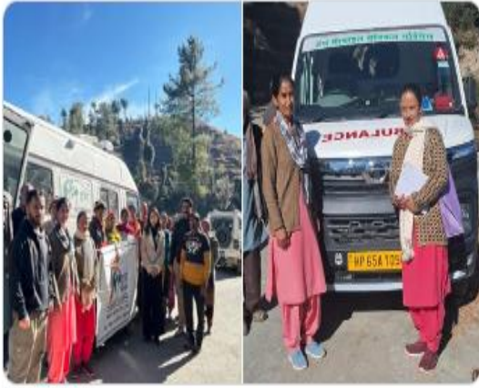
You and 9 others

ग्राम पंचायत खरल, गांव लोहानि, ब्लॉक Kihar at Salooni , चम्बा में 100 दिवसीय अभियान के तहत हंस फाउंडेशन (MMU) द्वारा मेडिकल कैम्प आयोजित किया। जिसमें 80+ लोगों की टीबी स्क्रीनिंग, स्पुटम सैपल रेफरल। इस कैम्प के माध्यम से आशा वर्कर्स व MMU टीम ने सराहनीय सहयोग दिया। #TBMukhtBharat