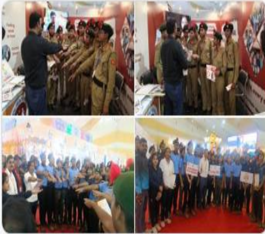
Ministry of Health and 8 others

NCC cadets took the pledge for #TBMuktBharat and expressed their support in reducing stigma, raising awareness/disseminating right information about TB etc. #PrevasiBhartiyaDivas2025 #TBHaregaDeshJeetega