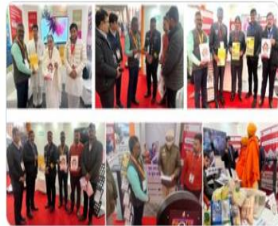
Ministry of Health and 7 others

National Youth Festival 2025: Viksit Bharat Young Leaders Dialogue in New Delhi, visitors were sensitized about Tuberculosis and how they can contribute to on-going 100-day Intensified campaign for TB Elimination #TBMuktBharat @MoHFW_INDIA