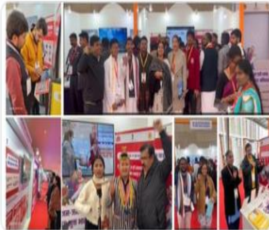
Ministry of Health and 7 others

Participant at the National Youth Festival 2025: Viksit Bharat Young Leaders Dialogue in Delhi were enthusiastic about the on-going 100-day Intensified campaign for TB Elimination. 700+ TB Free India pledge were taken digitally & 800+ selfies were taken. #TBMuktBharat @MoHFW_INDIA