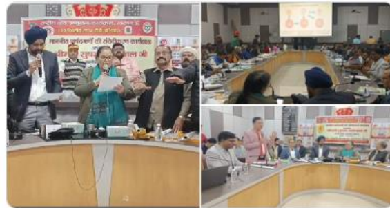
PMO India and 9 others

#टीबी_मुक्त_भारत #TBMuktBharat Translate post