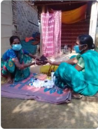
NITI Aayog and 2 others