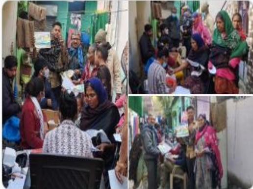
PMO India and 5 others

#amc #amcforpeople #TBMuktBharat Show more