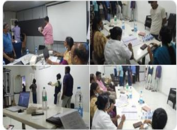
You and 8 others

100 day TB campaign - Screening camp conducted for workers at Nilkamal plastics and Sunbeam company, Koodapakkam area, Puducherry today by our NTEP staff. 213 individuals were screened today and spot sputum samples collected from 8 individuals with abnormal CXR findings.