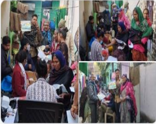
PMO India and 5 others

#amc #amcforpeople #TBMuktBharat Show more