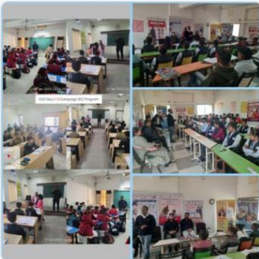
CMO Gujarat and 9 others

Chief District Health Office (CDHO) MEHSANA @CDHOMeh · 2h Youth Awareness activities at School/ Colleges regarding #100days TB Campaign at Mehsana and Satlasna #TBMuktBharat #tbaharegadeshjitega #TeamMehsana #ConnectGujarat @CollectorMeh @ddo_mehsana @GujHFWDept @NHMGujarat @Dwivedi_D @NtepGuj