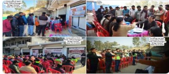
You and 3 others