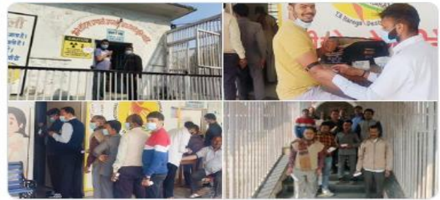
You and 3 others