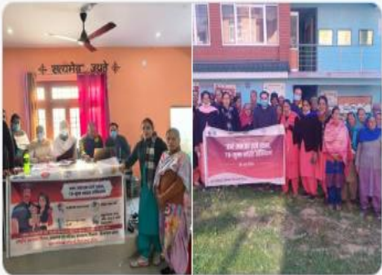
You and 9 others

गणतंत्र दिवस के अवसर पर ब्लॉक बगसेड़, मंडी में निक्षय शिविर आयोजित किया गया जिसमें हैंड-हेल्ड एक्स-रे का उपयोग करके 177 एक्स-रे किए गए। इस दौरान समुदाय को टीबी के प्रति जागरूक किया गया और जन भागीदारी अभियान में सक्रिय रूप से भाग लेने का संकल्प लिया गया। #TBMuktBharat