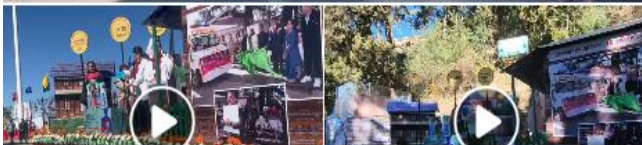
Comment as TB Mukta Bharat