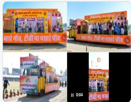
Collector and DM, Sundargarh and Collector & District Magistrate Mayurbhanj