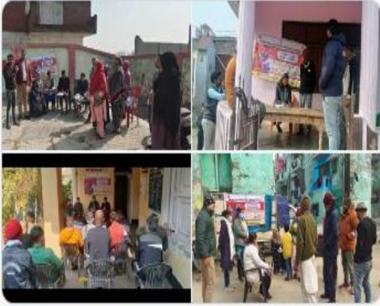
You and DDG - TB | #TBMuktBharat

NTEP RAMPUR (TB MUKT BHARAT) @NtepRampur · 4h xl ... #TBMuktBharat 100 दिवसीय सघन टीबी मुक्त भारत अभियान के अंतर्गत मलिन बस्तियों में कैंप लगाकर टीबी जागरूकता अभियान चलाया गया।