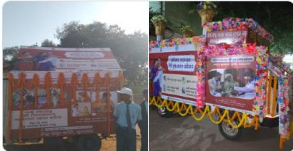
Collector and DM, Sundargarh and Collector & District Magistrate Mayurbhanj