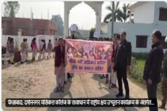
फ़ज़ाबाद: दर्शननगर मेडिकल कॉलेज के तत्वाधान में राष्ट्रीय क्षय उन्मूलन कार्यक्रम के अंतर्गत...

अपने क्षेत्र की खबरों के लिए डाउनलोड करें पब्लिक (Public) ऐप goo.gl/K25sy1