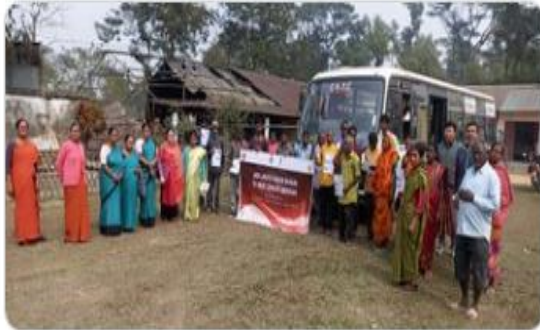
World Health Organization (WHO) and 3 others