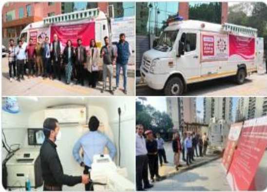
Indian Oil Corp Ltd and 9 others