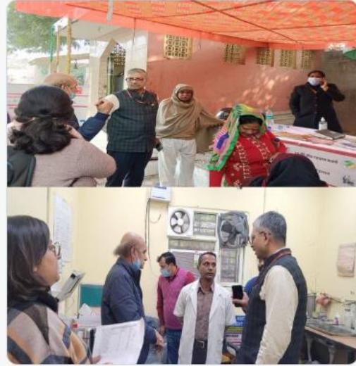
PMO India and 8 others